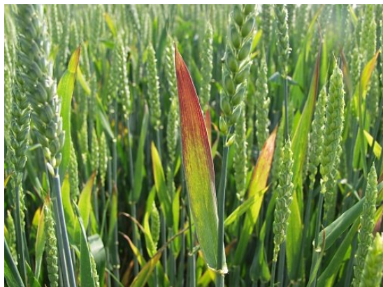
Billede 1 og 2. Havrerødsot i vinterhvede. Angreb viser sig pletvis i marken, hvor væksten er lavere, og efterhånden bliver bladspidserne gule og rødlige. I hvede ses symptomerne typisk fra april-maj og ses ofte senere end i vinterbyg.